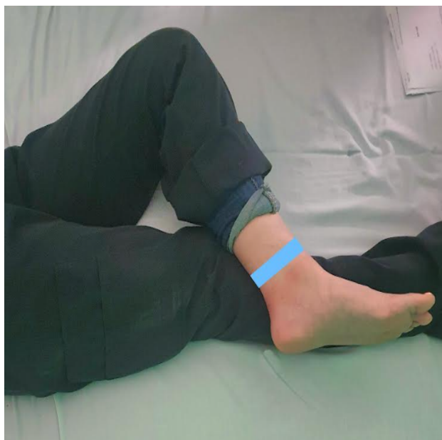
Fig. 2. Posición anatómica para rastreo de nervio tibial posterior; la zona azul representa lugar de ubicación de ultrasonido.

Ahora bien, al considerar la ejecución de RFP de nervio periférico, se pretende una prolongación mayor del tiempo analgésico, lo cual se logra por la reducción de dolor al aplicar un estímulo de lesión, a través de RFP activa en la zona proximal de la lesión, favoreciendo la neuromodulación y mejorando la sintomatología del dolor neuropático [9]. Esto es secundario a la generación de lesiones selectivas grandes en nociceptores principales pequeños como lo son fibras C y A \delta , además de la activación de vías inhibitorias descendentes noradrenérgicas y serotoninérgicas, y la inhibición de fibras tipo C, además de la disminución de citoquinas proinflamatorias como factor de necrosis tumoral \alpha e interleucina-6. Según lo planteado por Cheol Chang y cols. [10]. El proceso de RFP genera edema leve transitorio, que no afecta la integridad estructural de la barrera hemato-nerviosa, la activación de fibroblastos o depósito de colágeno [11].