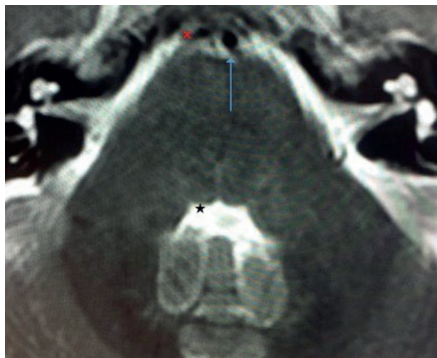
Fig. 2. Corte de referencia con arteria basilar de calibre y posición normal.

sigamos a todos los pacientes con PDA constatada o con sospecha de CPPD, desde el inicio del cuadro y contactemos con los servicios responsables para su atención.